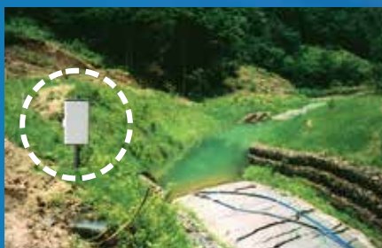
メモリー付ひずみ測定機 TCR-25A

メモリー付ひずみ測定器TCR-25Aは、接続ユニットTCU-20/40から簡単な操作でSDカードに正確な情報を、スピーディに収集することができます。